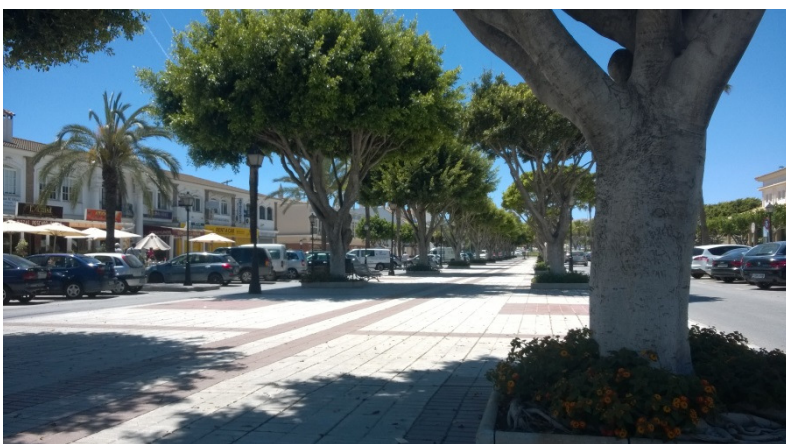
Maisemaa La Cala de Mijaksen rantakadulta